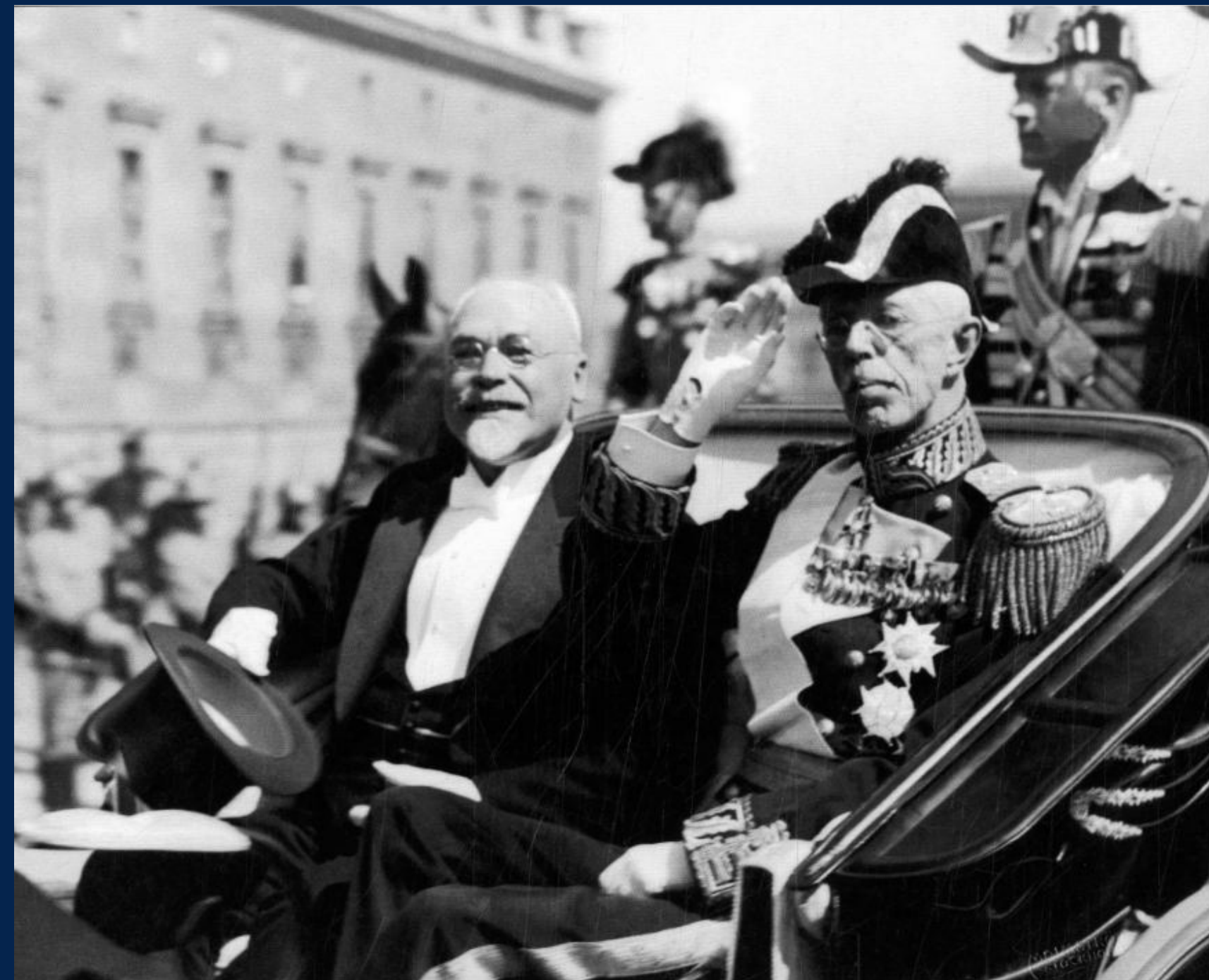
(GUSTAVS ZEMGALS AR ZVIEDRIJAS KARALI GUSTAVU V)