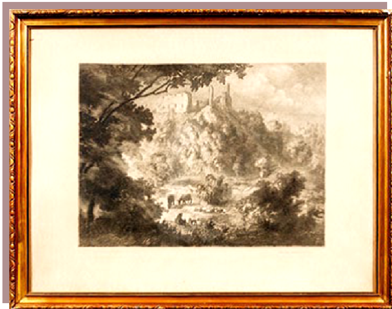
Voldemārs Krastiņš. Kokneses pilsdrupas. Oforts