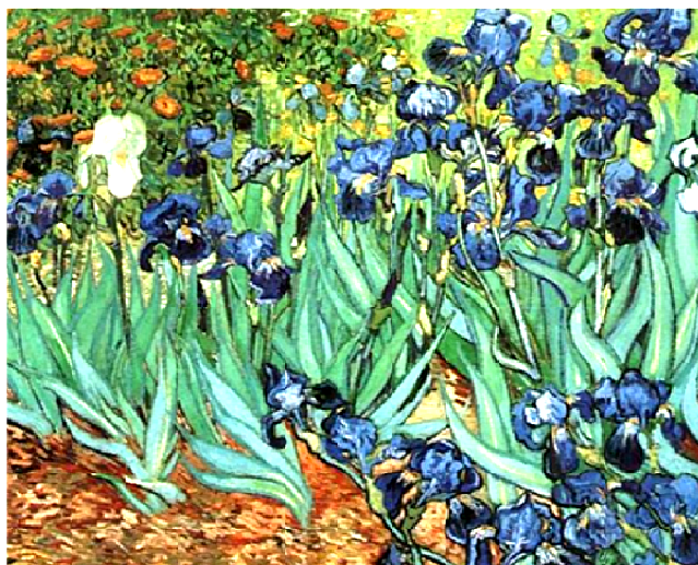
Vinsents van Gogs. Iri. Audekls, eļļa