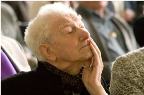
Attēlā — Imants Ziedonis